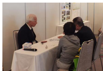
本学のコーディネータが貴社と教員の橋渡しになります

OUSフォーラムで産学官金連携を促進させ、岡山県のものづくり企業の発展・成長に貢献します。