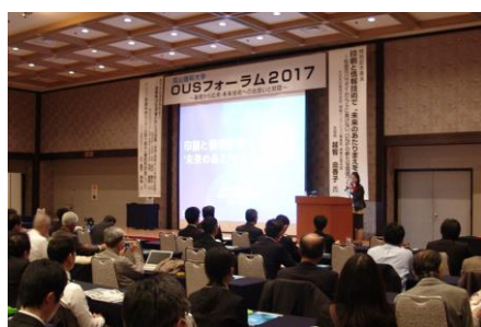
特別記念講演として国立情報学研究所 山田誠二教授に人工知能の可能性についてご講演いただきます