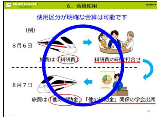
VOD 公的研究費の学内ルール編