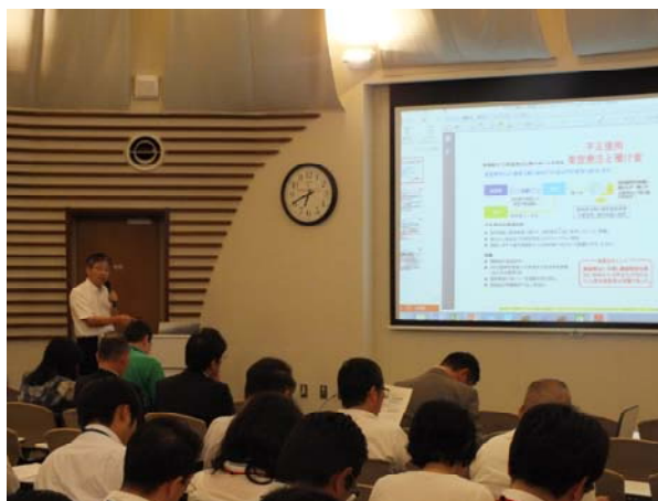
研究活動における研究倫理・研究費の コンプライアンスについての研修会

また、令和元年度には、文部科学省による「研究機関における公的研究費の管理・監査のガイドライン（実施基準）（平成26年2月18日改正）」に基づく履行状況調査が実施されました。調査の結果、本学で実施している運営・管理体制の瑕疵は認められませんでした。しかしながら、運用している制度の強化を図り、不正防止に取り組むよう指導を受け、公的研究費の執行に係る手続きについて、見直しを実施しています。