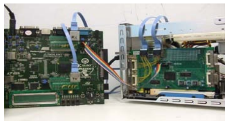
Fig.2 実験システムの写真