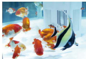
海水魚と淡水魚の混泳